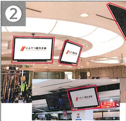
2 泉広場 ビジョン 時間帯 6:30~22:00(15.5時間) ビジョン台数 3台