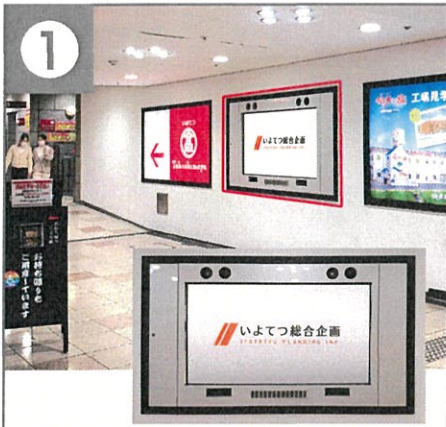
1 松山市駅口 ビジョン 時間帯 6:30~22:00(15.5時間) ビジョン台数 1台