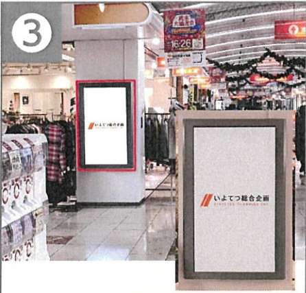
3 銀天街口 ビジョン 時間帯 8:00~21:30(13.5時間) ビジョン台数 1台

[掲出期間] 1ヵ月~ [音声] あり [放映枠数] 28枠限定(先着順) [放映時間] 1枠/15秒(7分に1回放映) [放映回数] 1日1画面あたり/115回~ ※意匠審査あり。 ※最低放送回数は、緊急放映・支障を含め90%稼働時の回数とします。 ※放映は、原則1週間同じ素材でお願いします。また放映等について、ご相談がございましたら担当までお問い合わせください。